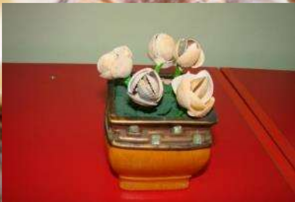
«Цветы в горшке»