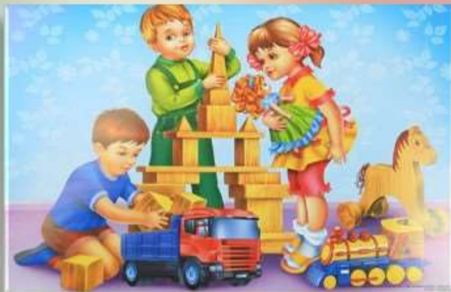
Рассматривание картины «Дети играют в кубики»