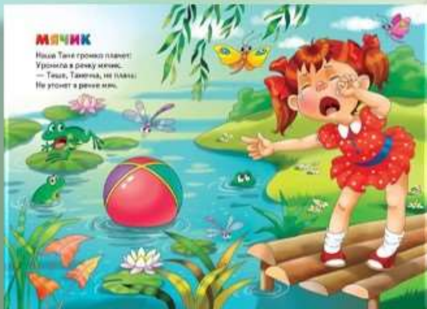
«Чтение и разучивание стихотворения А. Барто «Мячик»