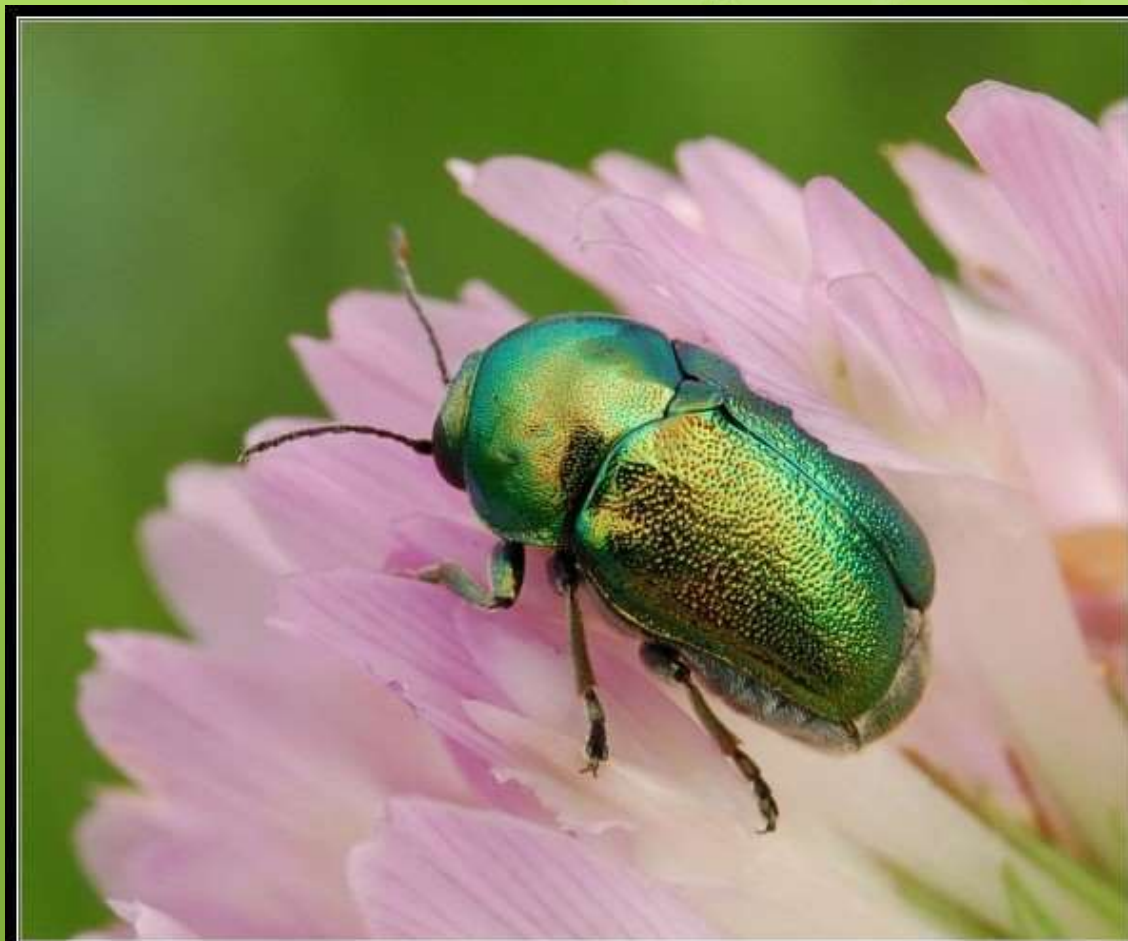
Скрытоглав зеленый ( Stylopsis sepioides )