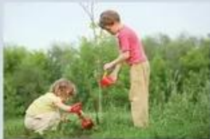
Ухаживать за растениями