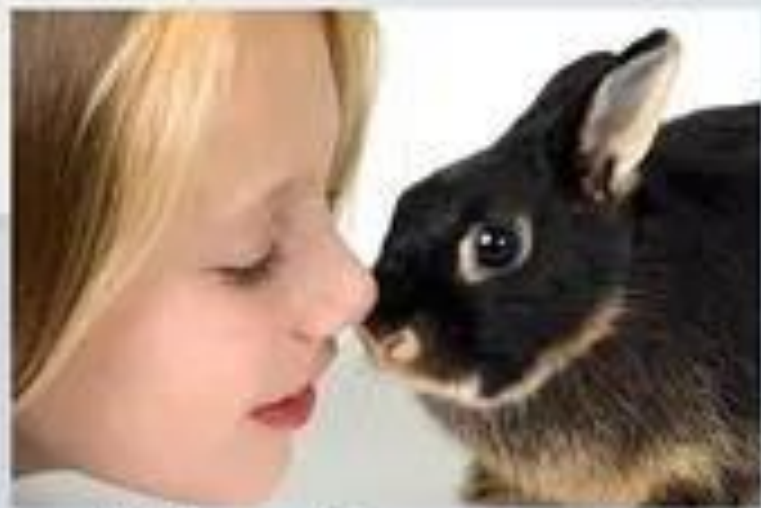
Любить и беречь животных