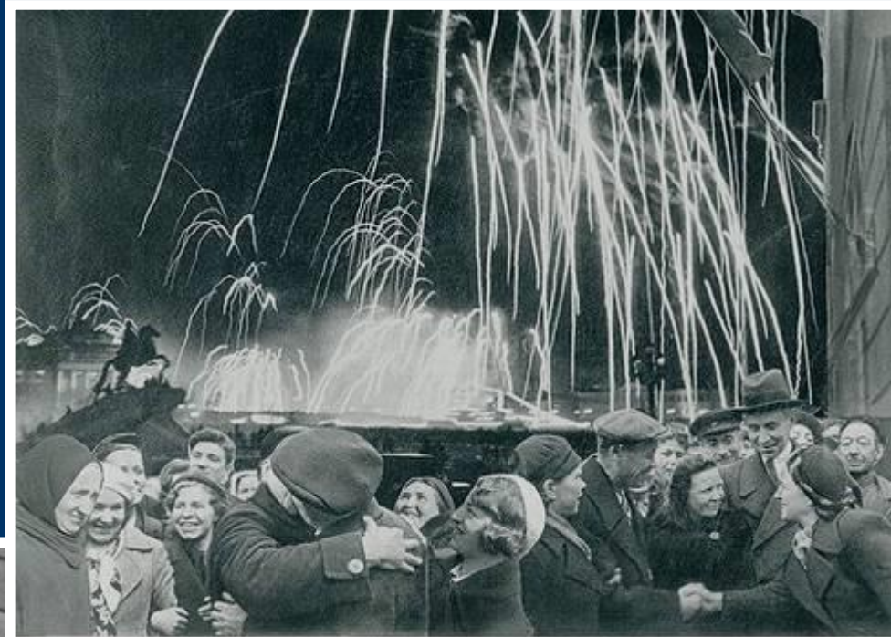
-Великая победа одержана советскими войсками под Ленинградом:

Победе радовалась вся страна, но эта радость была со слезами на глазах, так как в каждой семье, в каждом доме кто-то погиб на этой страшной войне.